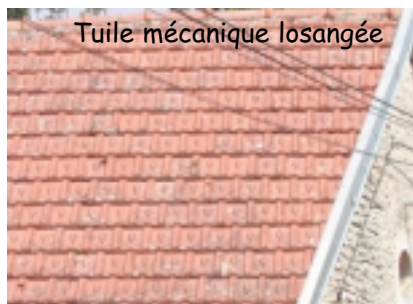
Tuile mécanique losangée